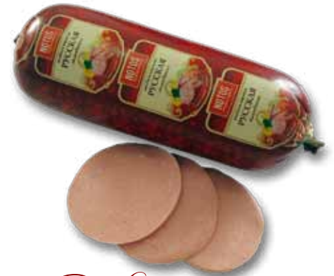
Колбаса вареная «Литовская»