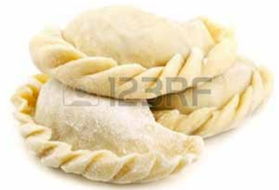
Вареники (с картошкой, с творогом)