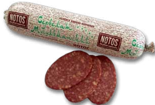
Колбаса варено-копченая «Сербский мусульманский Лотос»