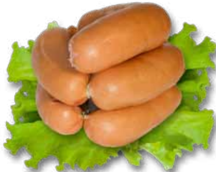
Сардельки в натуральной оболочке «Нотос»