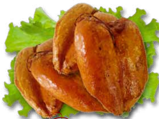
Грудка куриная варено-копченая