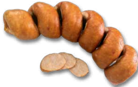
Колбаса варено-копченая «Куриная»