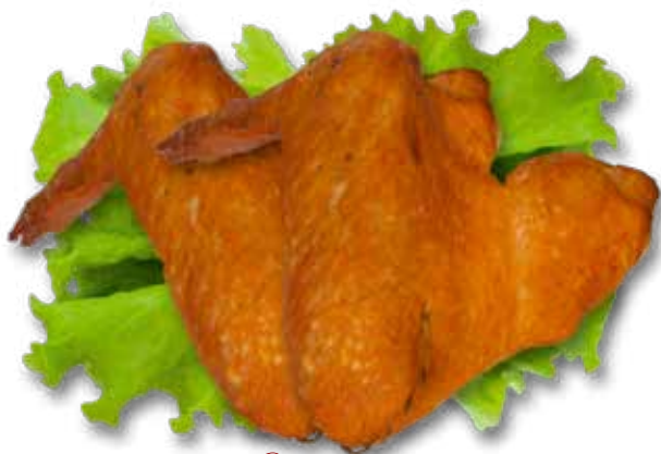
Крылышки куриные варено-копченые