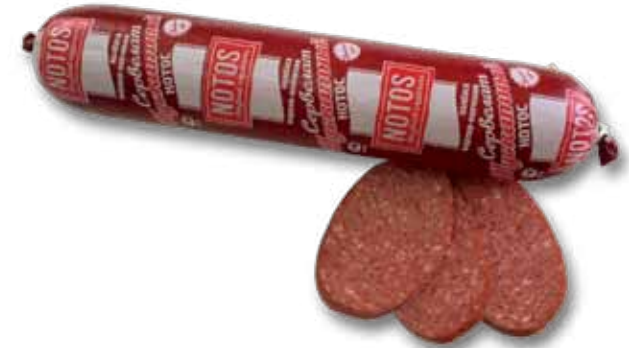
Колбаса варено-копченая «Сербский луксатный Лотос»