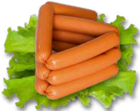
Сосиски молочные в белой оболочке «Нотос»