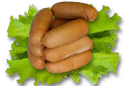
Миниарки в натуральной оболочке «Нотос»