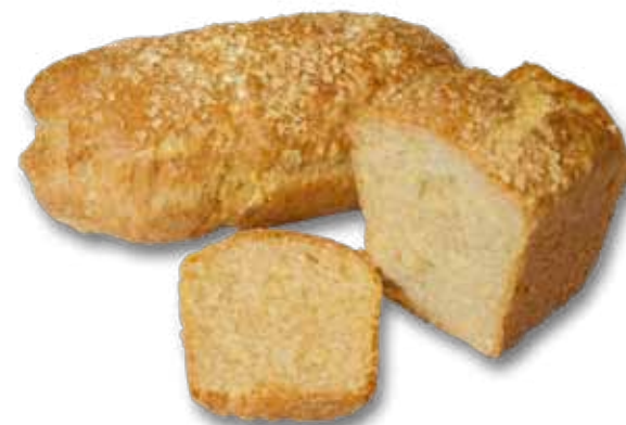
Хлеб с кукурузной мукой