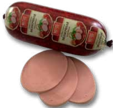
Колбаса вареная «Молочная»