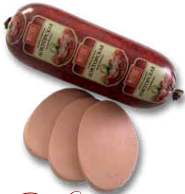
Колбаса вареная «Докторская»