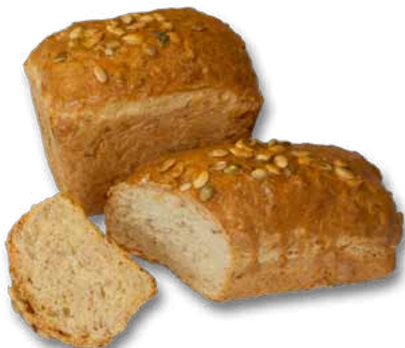
Хлеб с семенами туньки