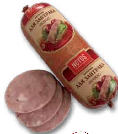
Паштет «Для завтрака»