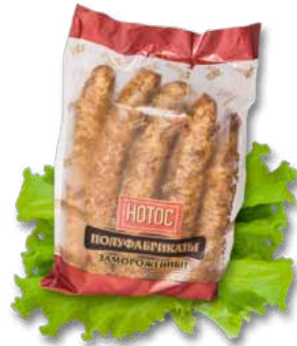
Колбаски для жарки «Мюнхенские»