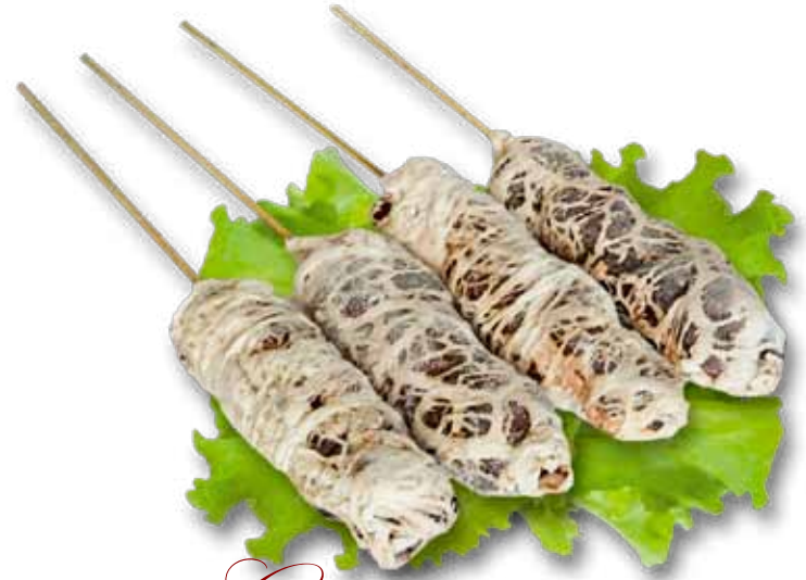
Сурлаки из печени