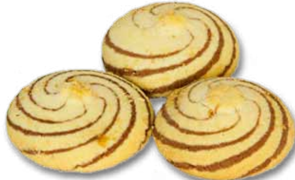
Нерене Паймурка nobopom