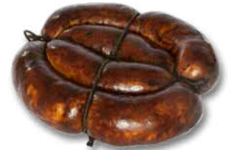
Колбаса «Украинская жареная»