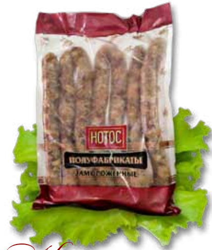
Колбаски для жарки «Даварские»