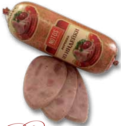
Ветрина uz ungerinku