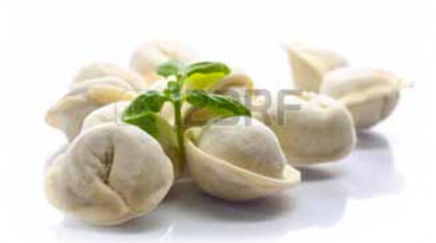
Пельмени (куриные, говядина со свиной, говяжьей)