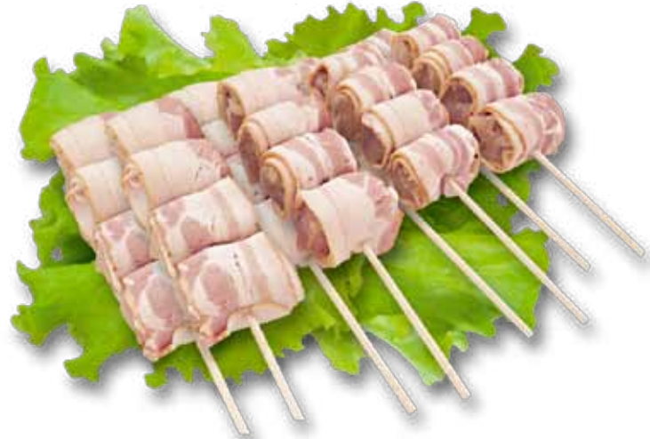
Сурлаки куриные с беконом