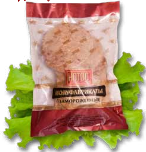
Котлеты для грильбуфетов (куриные, говяжьи, свиная с говядиной)