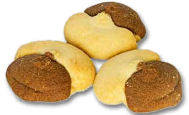
Bunera Dem u noru