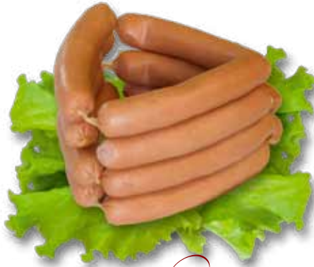
Сосиски «Паварские с сыром» «Нотос»