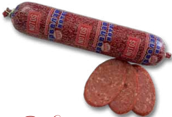
Колбаса варено-копченая «Сербский Лотос»