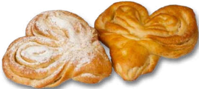
Булочка с вишней