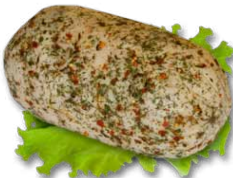
Судет куриный с грибами