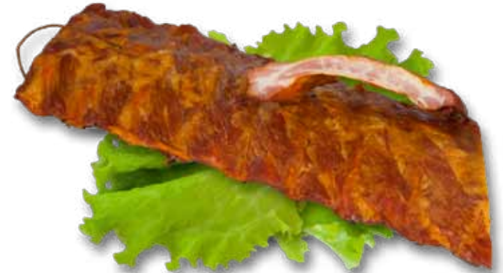
Порки свиные варено-копченые