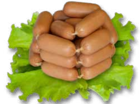
Сосиски молочные «Тедди»