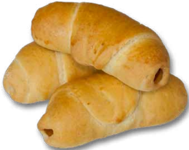
Бораник с начинкой