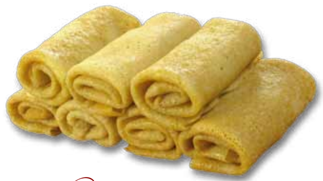
Блины с мясом птицы