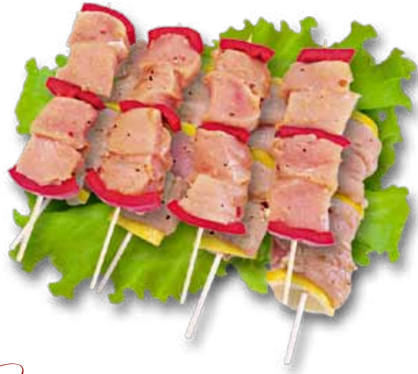
Сурлаки куриные с перцем, с лимоном