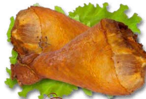
Голеи куриная варено-копченая