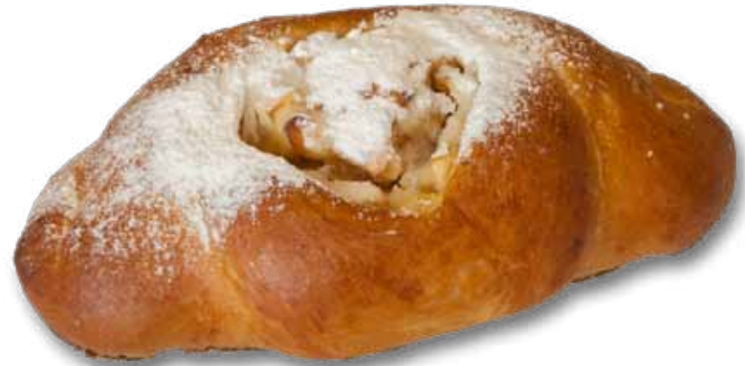
Булочка с аджикой