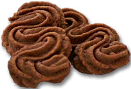
Нереве Снупа.ика шоко.ладная