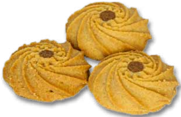
Нерене Купаде nobopom